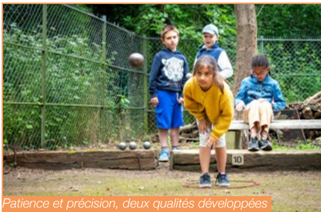
Patience et précision, deux qualités développées avec la pétanque.