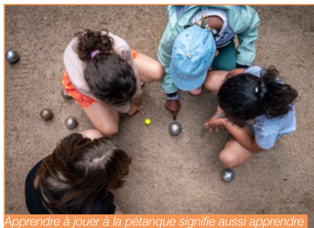
Apprendre à jouer à la pétanque signifie aussi apprendre à compter les points.