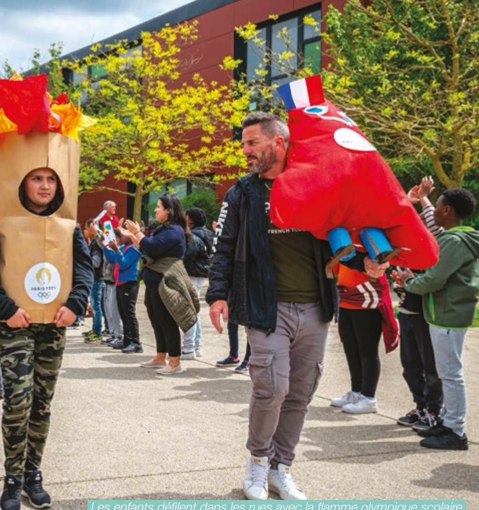
Les enfants défilent dans les rues avec la flamme olympique scolaire.