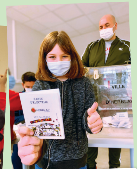
Accueil de loisirs « Les Acacias »