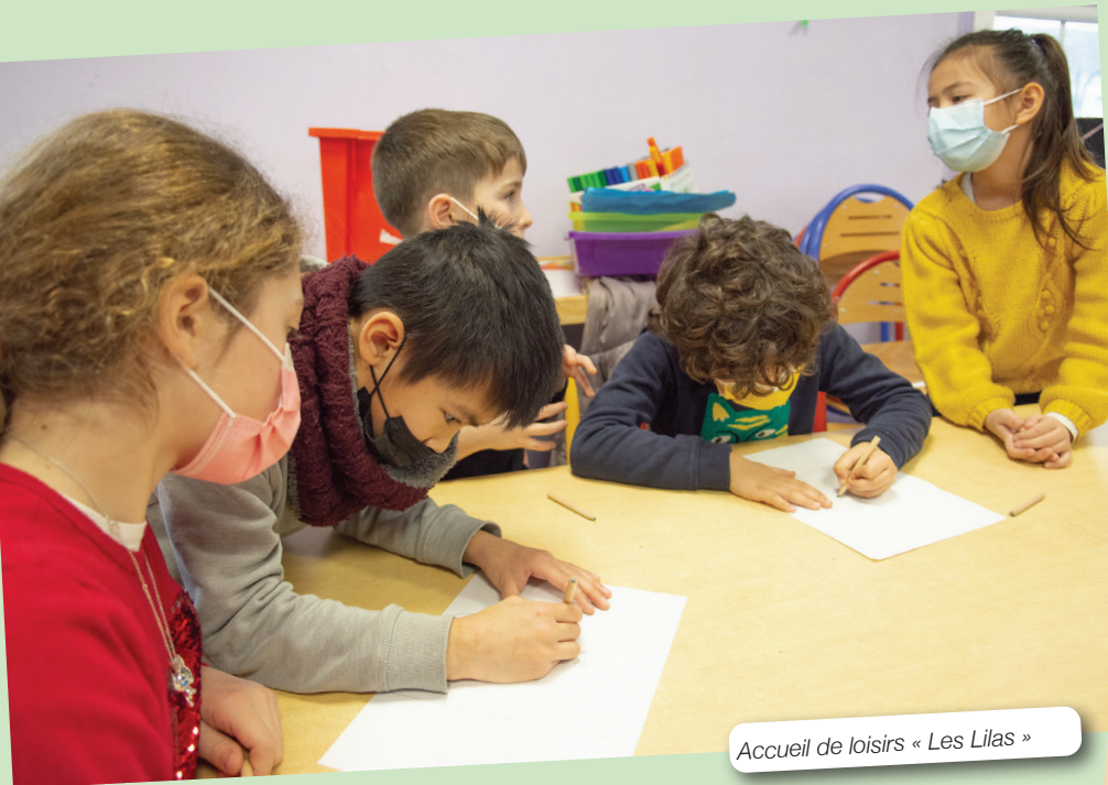
Accueil de loisirs « Les Lilas »

Dans une période marquée par des rendez-vous électoraux, 270 enfants âgés de 6 à 10 ans et fréquentant les cinq accueils de loisirs de la ville se sont lancés dans un projet participatif et citoyen hors du commun : composer le logo de leur centre !