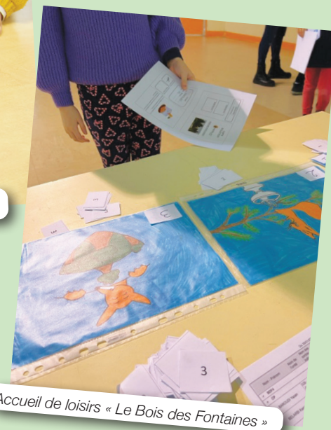
Accueil de loisirs « Le Bois des Fontaines »