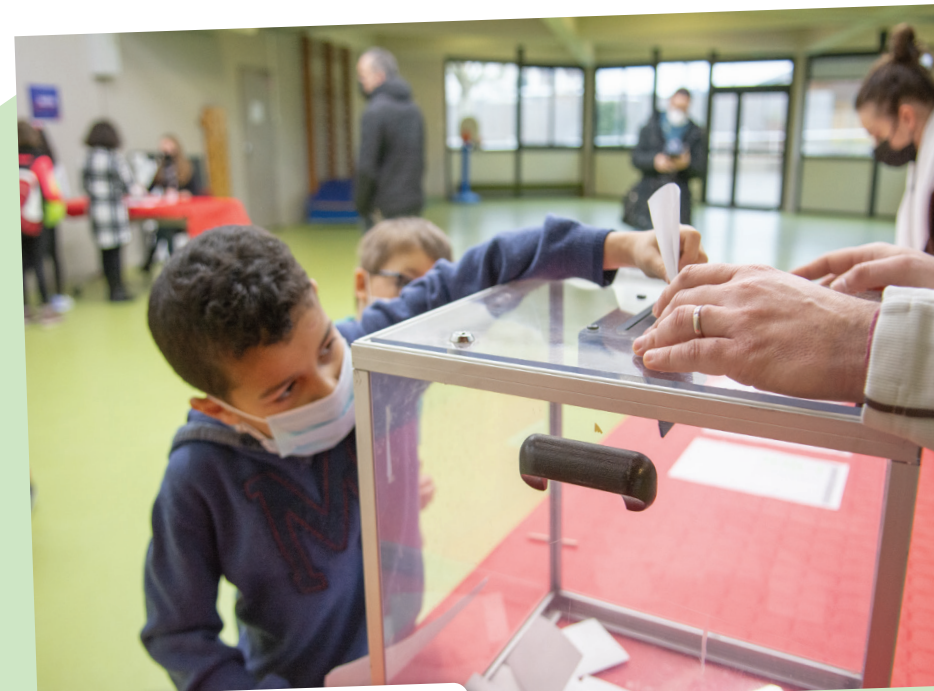
Accueil de loisirs « Les Chênes »