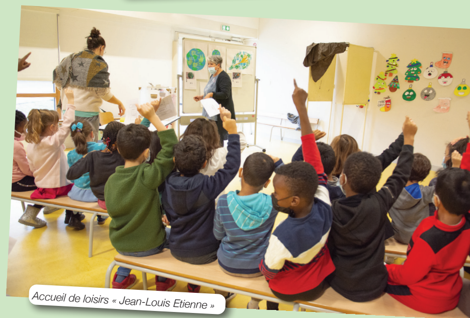
Accueil de loisirs « Jean-Louis Etienne »